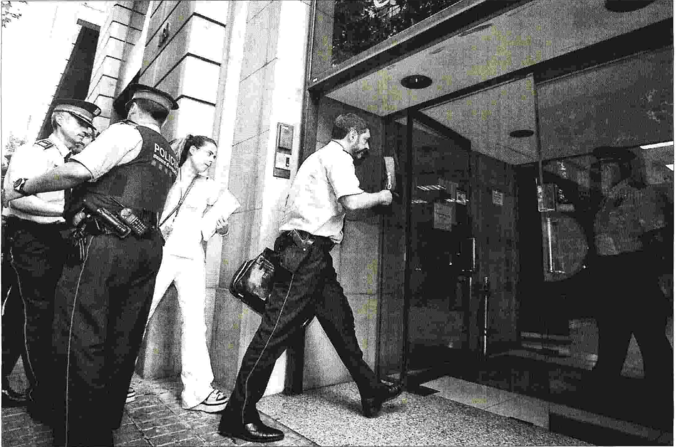
Josep Lluís Trapero entra ayer en la sede del Tribunal Superior de Justicia de Cataluña.