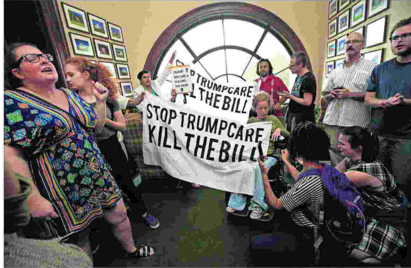
Protesta contra la reforma sanitaria republicana, el lunes en el despacho del senador de Ohio Rob Portman en el Capitolio.

El rechazo de cuatro senadores al proyecto auspiciado por el presidente ha impedido su aprobación parlamentaria. P3