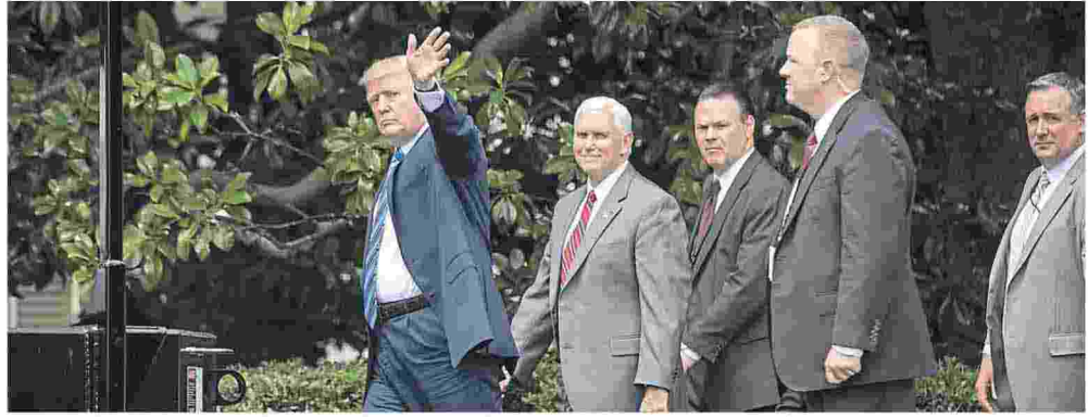
Le bras de fer se poursuit entre l'administration Trump et Téhéran.

SANCTIONS Après avoir juré de rejeter le « pire accord jamais signé » sur le gel des installations nucléaires en Iran en 2015, le président Trump a finalement reconduit la suspension des sanctions internationales contre Téhéran. Mais Washington maintient la pression sur les « actions déstabilisatrices » de Téhéran au Proche-Orient, notamment son programme balistique et son influence notoire dans les conflits au Yémen et en Syrie, sans oublier son soutien au Hezbollah au Liban et aux régions chiites d'Irak. De nouvelles sanctions ont été décidées contre 18 personnes. // PAGE 4