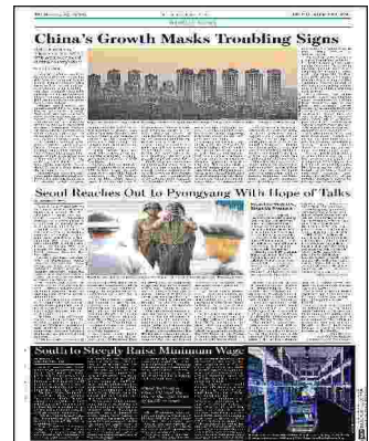
A customer browses the shelves at a store in Hanam, South Korea. A wage commission deliberated for three months before acting.